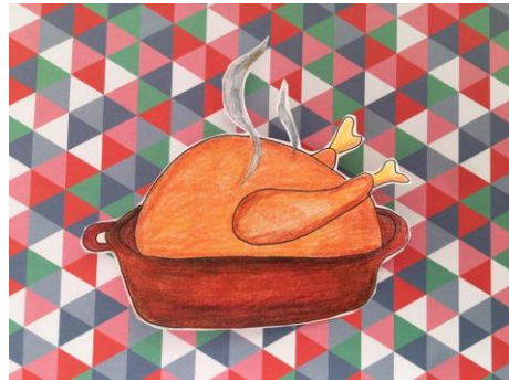
POLLASTRE AL FORN