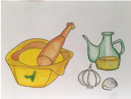
ALL I OLI