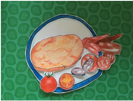
PA AMB TOMÀQUET I EMBOTITS