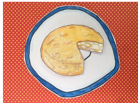
TRUITA DE PATATES