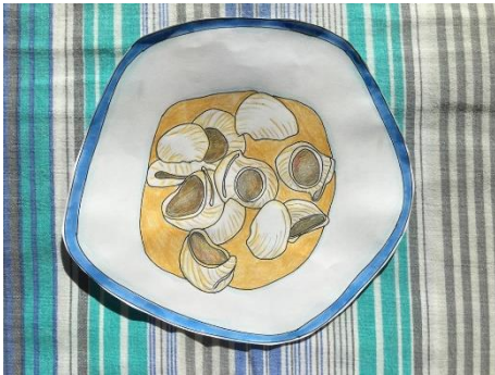
SOPA DE GALETS