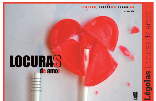
Légolas Locuras de amor

Alumnado de Primaria. Máximo: 30 participantes.